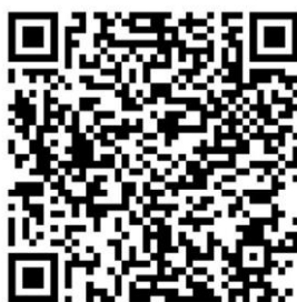
Google Play Store